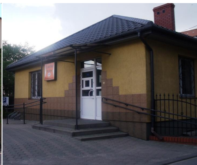
Apteka „Oak” przy ul. 3 Maja 51. Apteka „Melisa” przy ul. Lipowej 53.