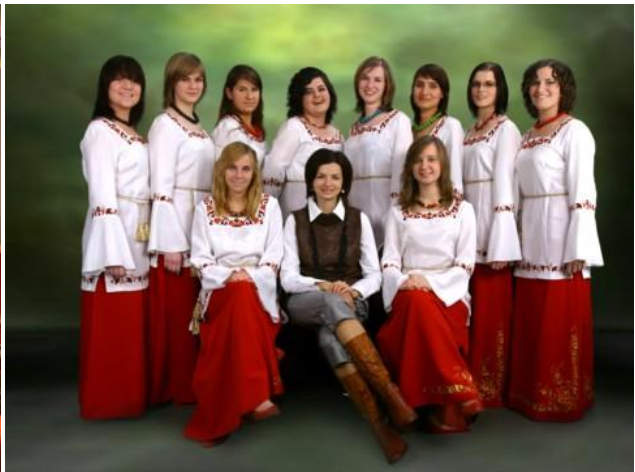
Zespół „Echo Puszczy”. Zespół „Zniczka”