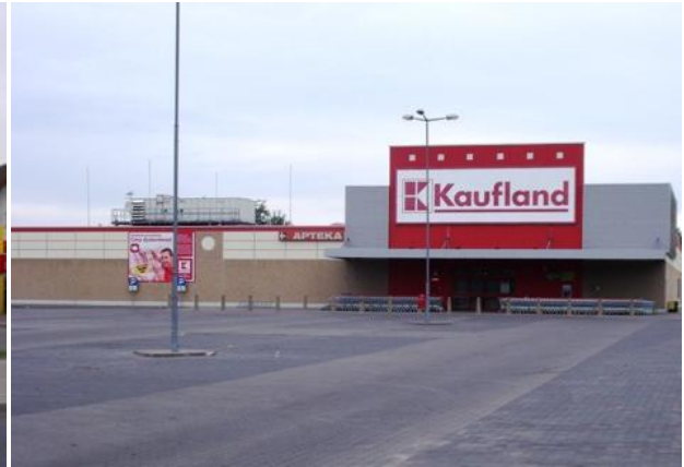
Supermarket PSS „Społem” oraz „Kaufland” przy ulicy Batorego