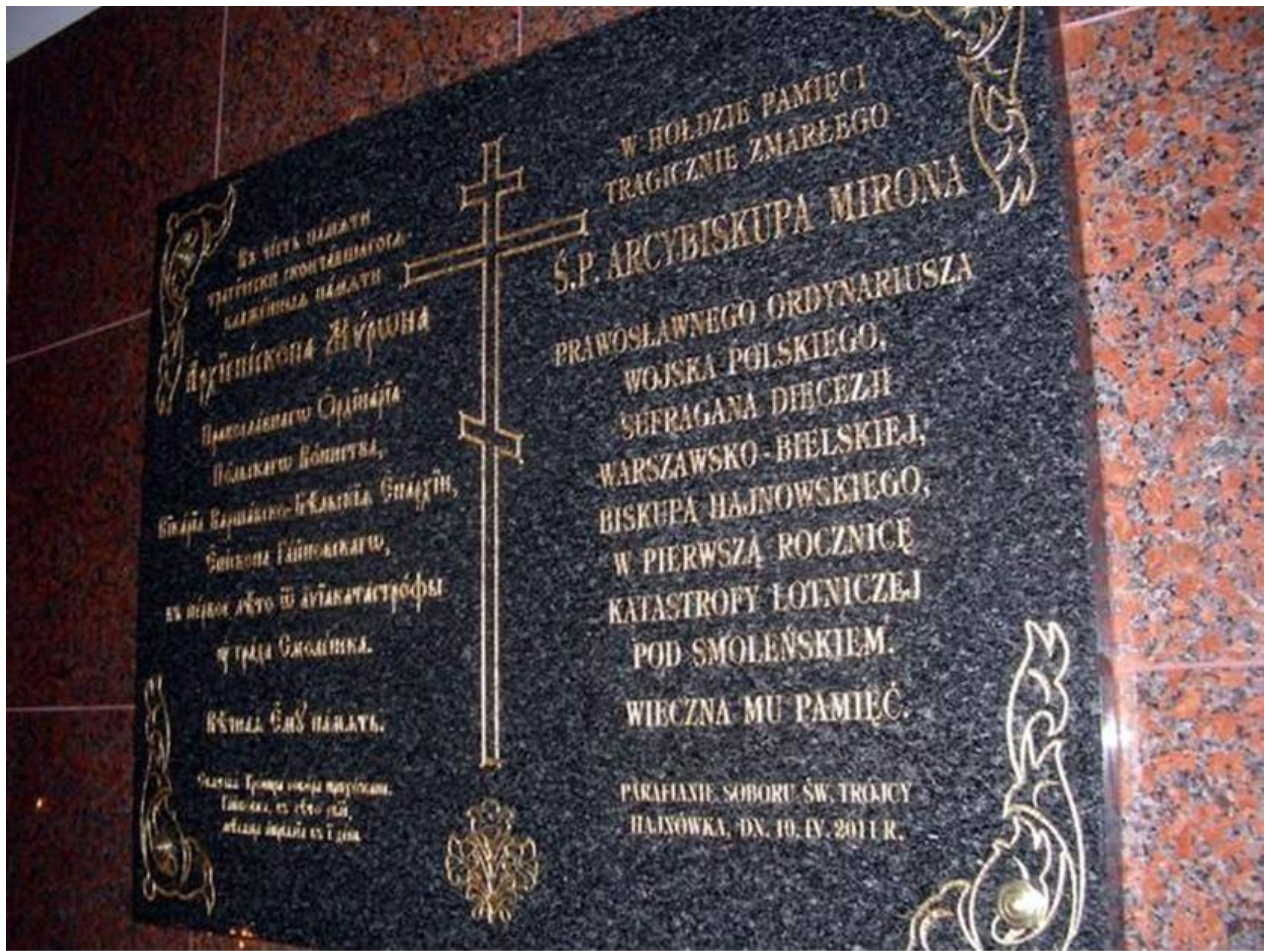
Płyta poświęcona pamięci tragicznie zmarłego Ś. P. Biskupa Mirona w Soborze Św. Trójcy