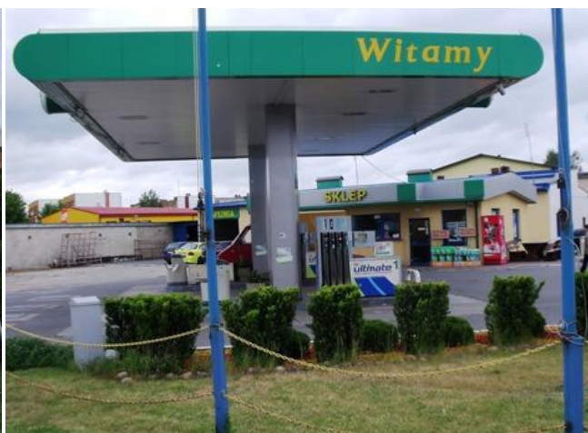
Stacja CPN „Orlen” przy ul. Sportowej, Stacja CPN przy ul. Białowieskiej