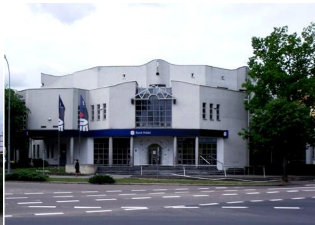
Bank PKO S.A. Oddział w Hajnówce oraz Urząd Skarbowy. PKO Bank Polski, Oddział 1 w Hajnówce przy ul. 3 Maja 46