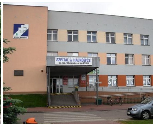
Bank BGŻ. Szpital Powiatowy im. Włodzimierza Mantiuka (1997) z apteką „Salix” przy ul. Lipowej 190.