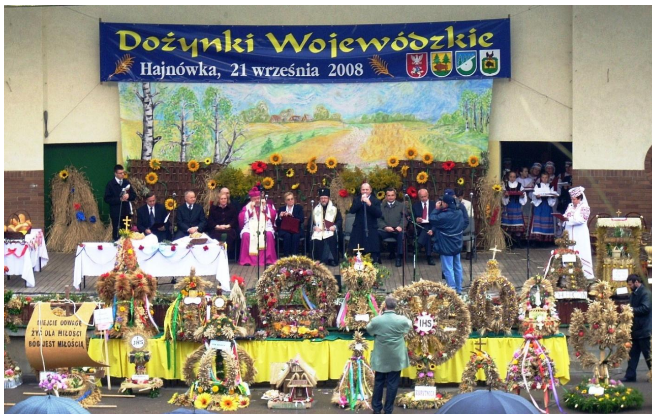
Dożynki Wojewódzkie z udziałem ministra rolnictwa Marka Sawickiego