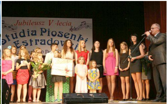
Zespół „Przepiórka”. Studio Piosenki Estradowej przy HDK