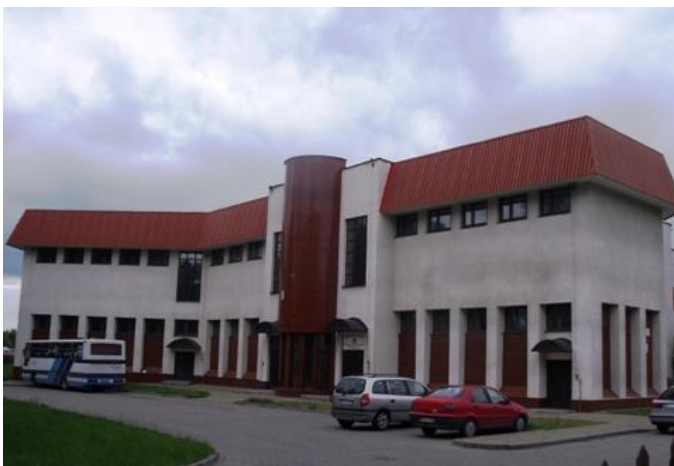
Zespół Szkół nr 3. Muzeum i Ośrodek Kultury Białoruskiej (2004).