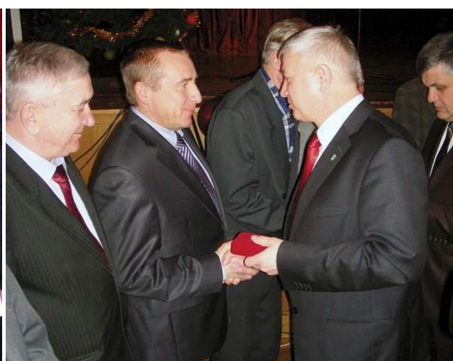
Uroczystości z okazji 60-lecia nadania Hajnowce praw miejskich