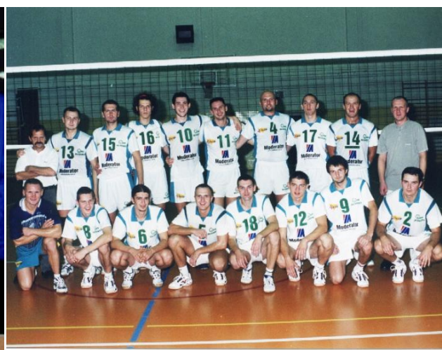
Judocy z Hajnówki z mistrzem olimpijskim Pawłem Nastulą. Siatkarze Moderadora OSiR Hajnówka w sezonie 2002/2003