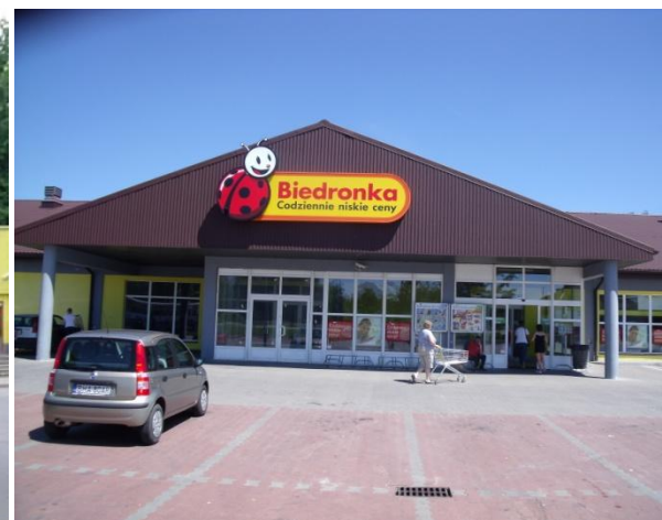
„Biedronka” przy ul. 3 Maja i Białowieskiej