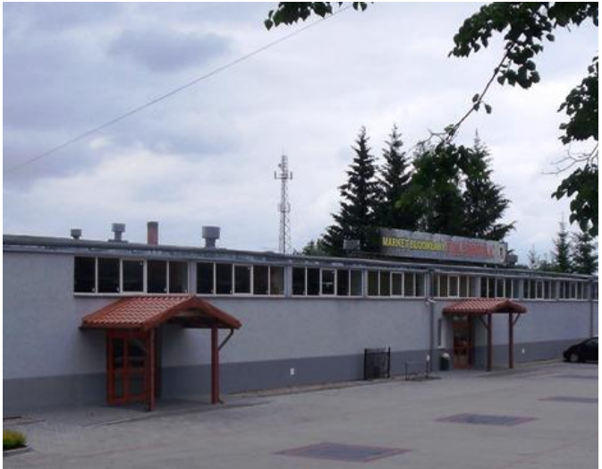
Sklep „Archelan” w dawnym kinie „Leśnik”, Market Budowlany „Fachowiec” przy ul. Armii Krajowej