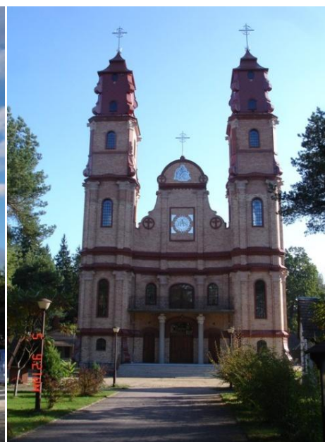
Kościół Klarysek, Kościół Św. Cyryla i Metodego