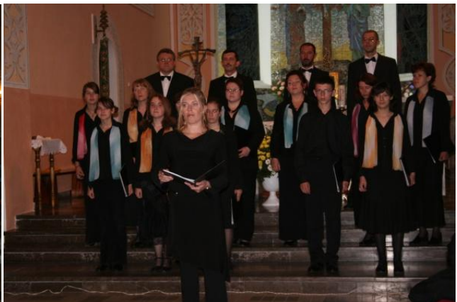
Chór „Tutti Cantare”. Chór Kameralny