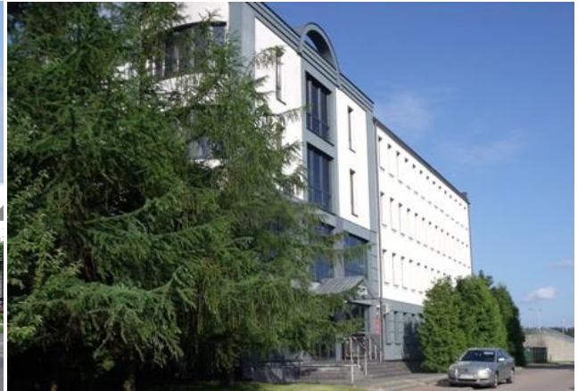
Pogotowie Ratunkowe (2010) przy ul. Prostej. Budynek Sądu i Prokuratury Rejonowej (2003)