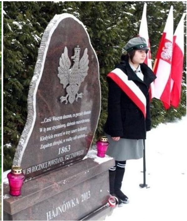
Pomnik ofiar mordów mieszkańców Siemiatycz w okresie okupacji sowieckiej w dzielnicy Judzianka. Pomnik upamiętniający 150. Rocznicę wybuchu Powstania Styczniowego przy kościele pw. Podwyższenia Krzyża Świętego