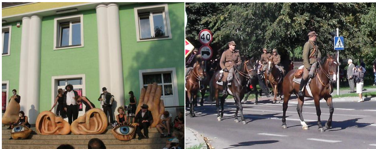
Międzynarodowy Festiwal Teatralny "Wertep", przejazd ułanów III Pułku Strzelców Konnych na boisko w lesie 20 września 2009 r.