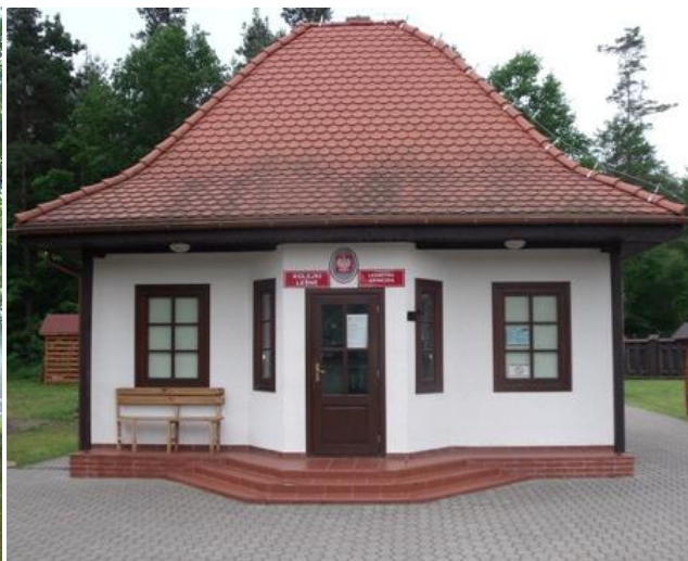
Centrum Promocji Regionu i Międzynarodowego Festiwalu Muzyki Cerkiewnej „Czerlonka” , Stacja Kolejki Wąskotorowej.