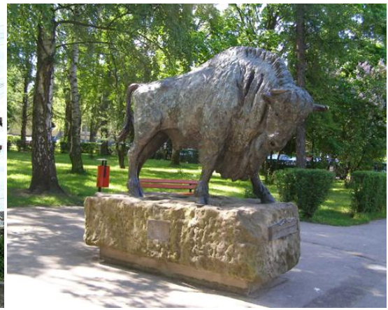
Muzeum Kowalstwa i Ślusarstwa Stanisława Mierzwńskiego. Żubr na Skwerze dr Dymitra Wasilewskiego