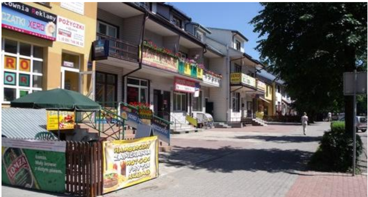
Sklepy, zakłady usługowe przy ulicy 3 Maja