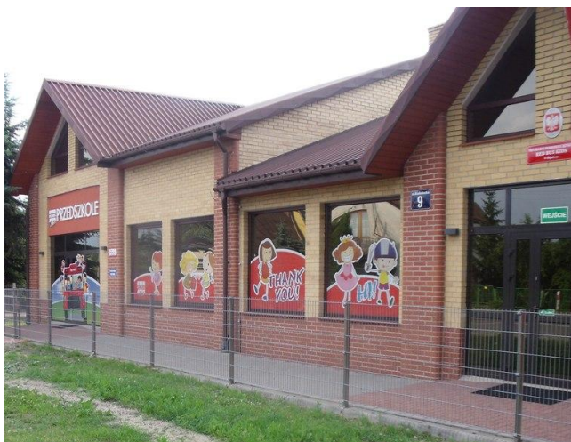
Przedszkole „Leśna Kraina” przy ul. Orzeszkowej 18. Przedszkole Językowe Red Bus Kids przy ul. Białostockiej 9