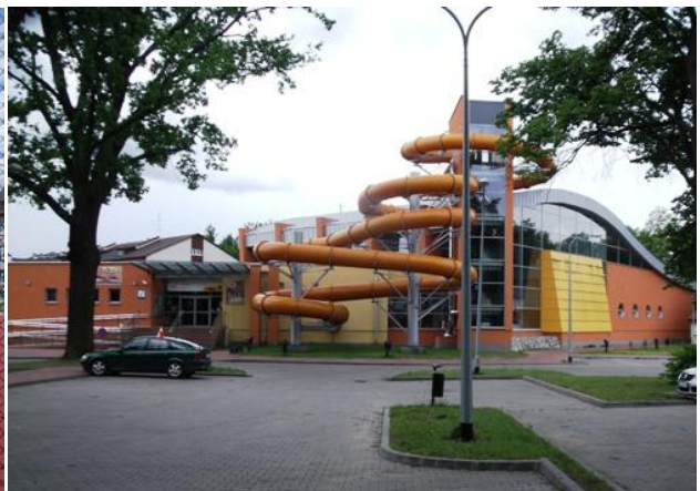
Boisko „Orlik” przy Zespole Szkół Nr 1, Park Wodny przy ul. 3 Maja