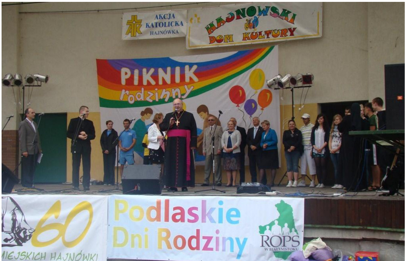
Piknik Rodzinny organizowany przez Akcję Katolicką i HDK