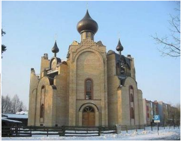
Cerkiew św. Dymitra. Cerkiew Narodzenia św. Jana Chrzciciela.