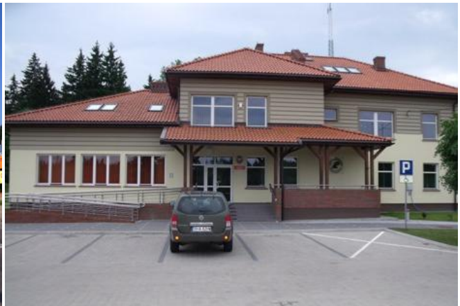
Serwis „Fiata” przy ul. Warszawskiej, Nadleśnictwo „Hajnówka”