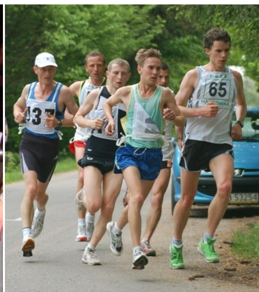
Mistrzostwa Hajnówki w wyciskaniu leżąc. Półmaraton Hajnowski