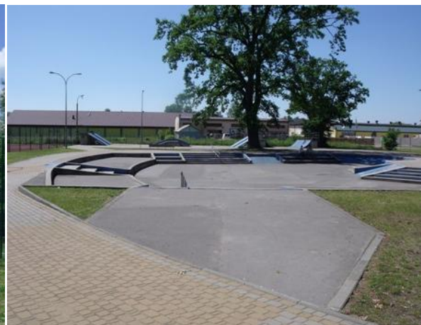
Boisko „Orlik” przy Zespole Szkół Ogólnokształcących nr 1. Skatepark przy ul. Parkowej