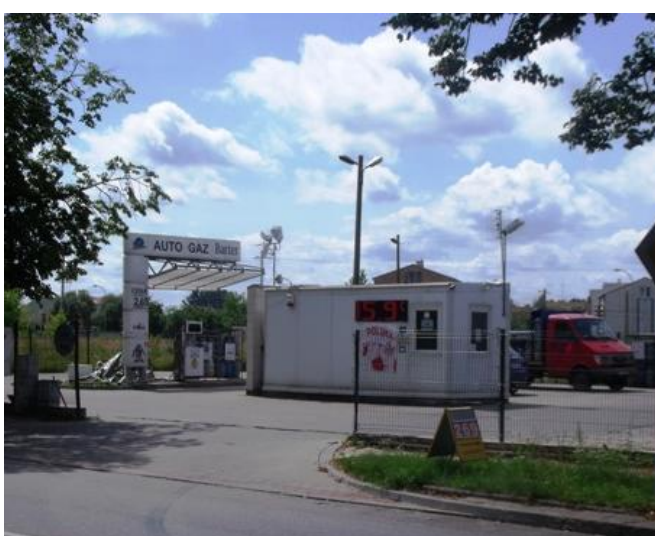
Stacja CPN „Pronar” przy ul. Białostockiej. Stacja „AutoGaz” przy ul. 3 Maja