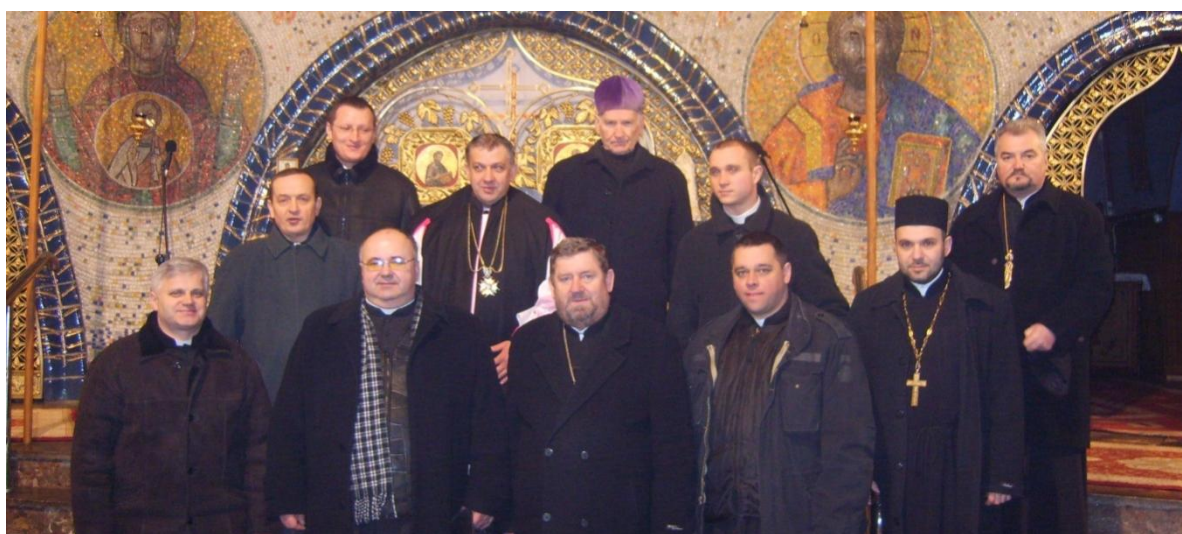
Księża parafii katolickich i prawosławnych w Soborze Św. Trójcy z okazji mszy ekumenicznej w 2010 r.