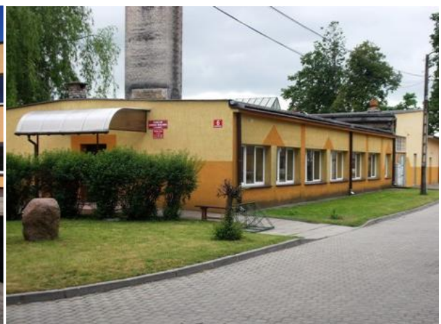
Zakład Komunikacji Miejskiej w Hajnówce. Zakład Gospodarki Mieszkaniowej.