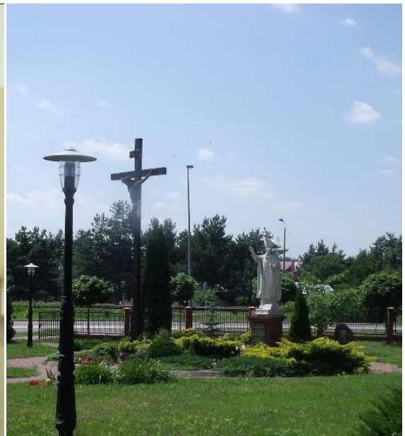
Kaplica szpitalna. Pomnik Jana Pawła II przy kościele pw. Podwyższenia Krzyża Świętego, obok dęb Jana Pawła II posadzony w 2005 roku