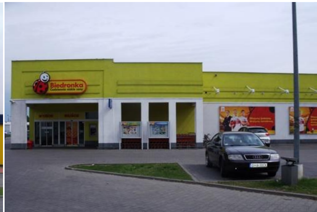
„Media expert” i „Biedronka” przy ulicy Batorego