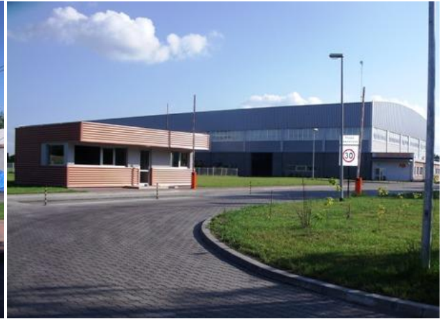
Biuro Przedsiębiorstwa Usług Komunalnych, Zakład Zagospodarowania Odpadów (2011)