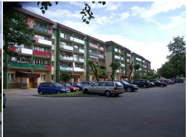
Osiedle Podlasie wybudowane w latach 1992-1996. Budynki przy ulicy Armii Krajowej tzw. Manhattan (1992)