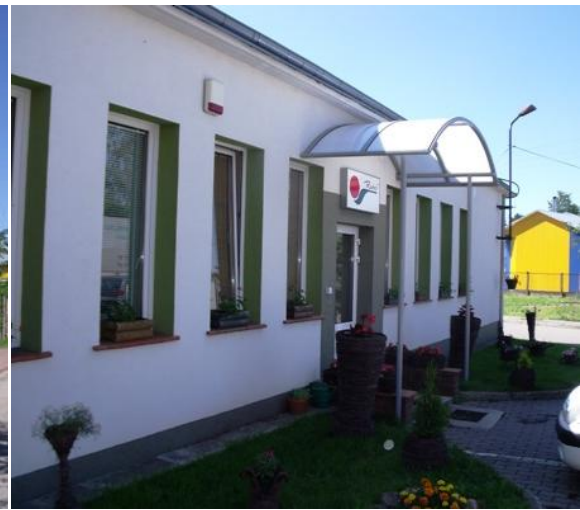
Biuro Przedsiębiorstwa Energetyki Ciepłej na ul. Łowczej. Spółka „Runo”.