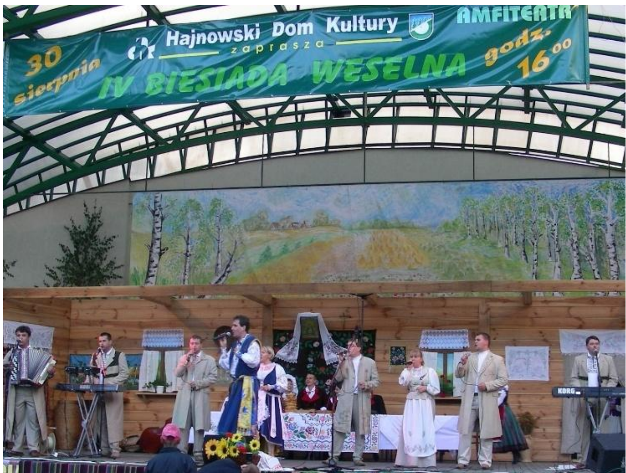
Występy podczas Biesiady Weselnej