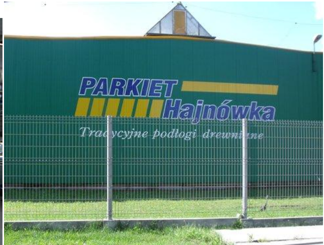
Spółka „Forte” i Zakład „Parkiet” Hajnówka na terenie dawnego HPPD