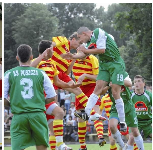
Festyn „Krynoczka”, mecz Jagiellonia-Puszcza z okazji 70-lecia klubu „Puszcza” Hajnówka w 2007 r.