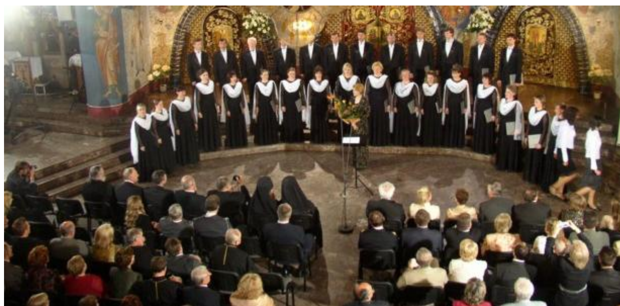
Występ konkursowy w Soborze Św. Trójcy podczas Hajnowskich Dni Muzyki Cerkiewnej