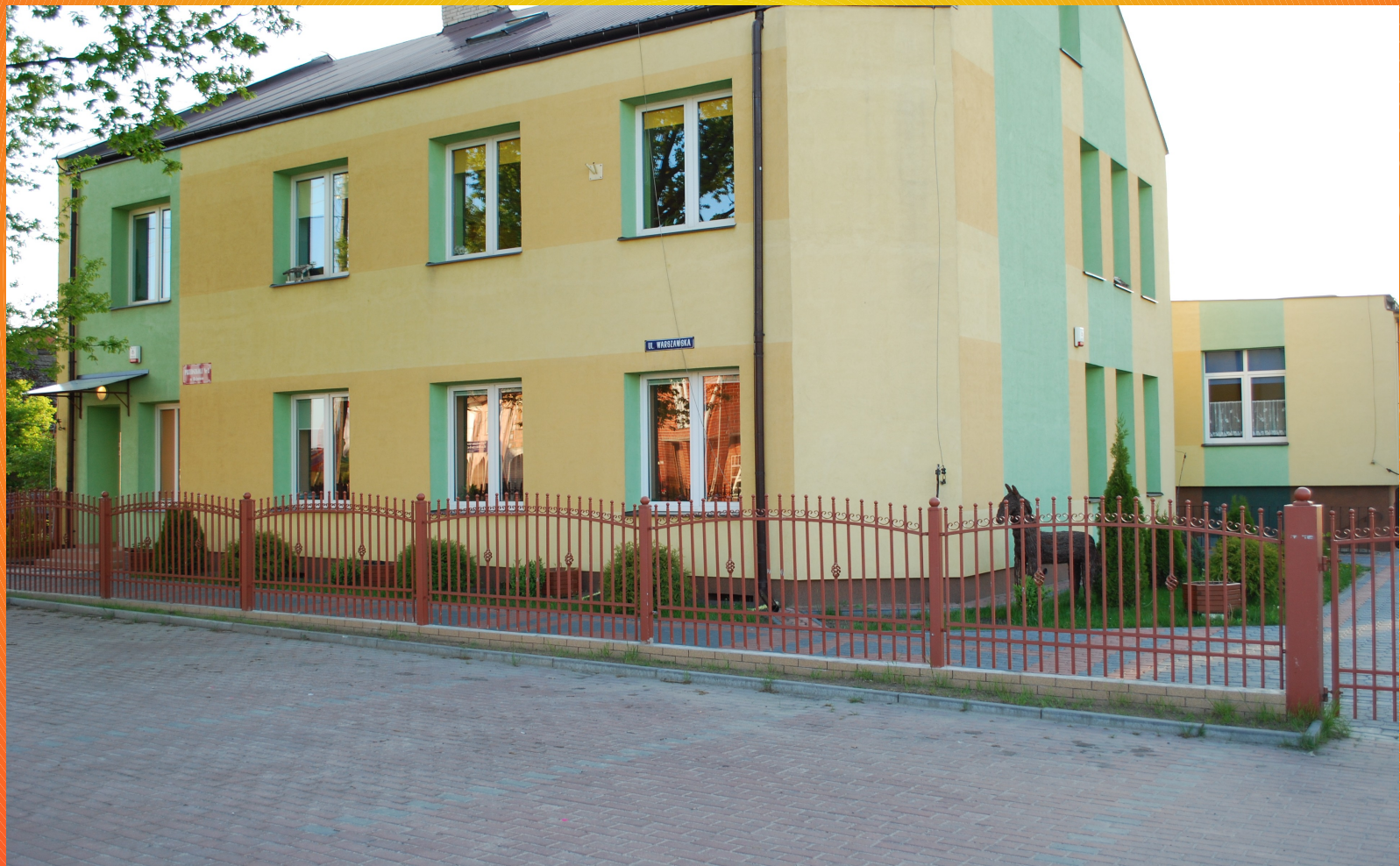
Budynek Przedszkola nr 2 w Hajnówce

Do Przedszkola Nr 2 w Hajnówce uczęszcza 108 dzieci.