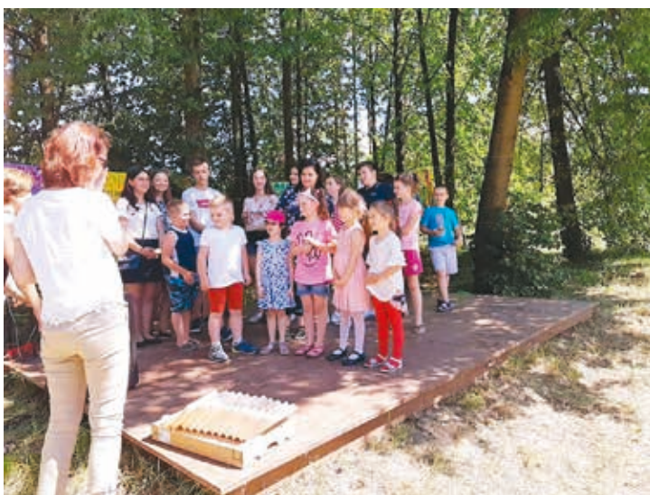
Wspólny występ młodych artystów – podopiecznych Szkoły Podstawowej w Orzeszkowie.