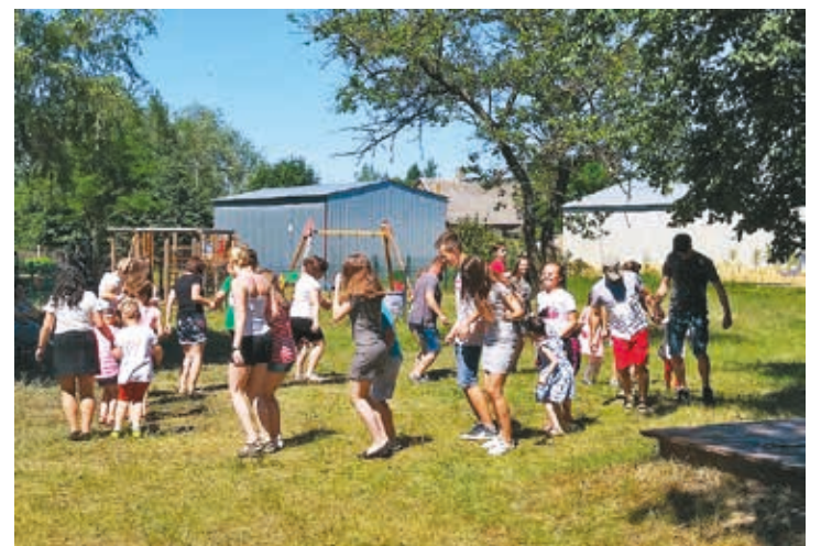
Piknik Rodziny był okazją do wspólnych gier i zabaw mieszkańców.