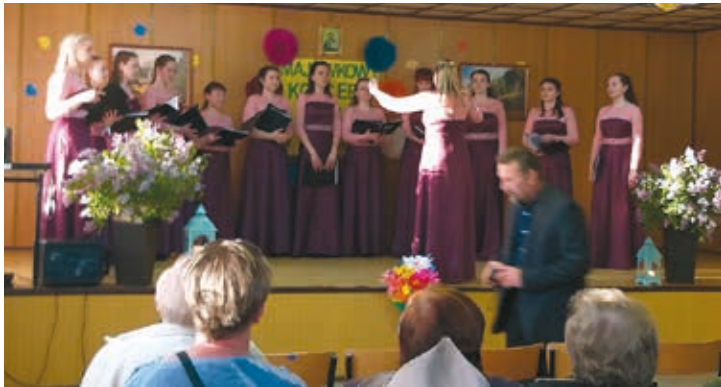
Zespół Wokalny „SWIREL” z Mińska

Dnia 9 maja 2019 r. świetlica wiejska w Trywieży wypełniła się publicznością, która przybyła na Majów-