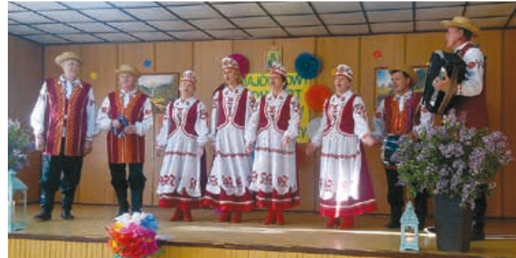
Czyżowanie z Czyż

Organizatorami MAJÓWKOWEGO KONCERTU GŁOSÓW W TRYWIEŻY byli: Wójt Gminy Hajnówka oraz Gminne Centrum Kultury w Dubinach.