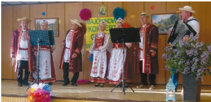
Żawaranki z Mochnatego

kowy Koncert Głosów. Na scenie zaprezentowały się regionalne zespoły amatorskiego ruchu artystycznego, tj. Żawaranki z Mochna-