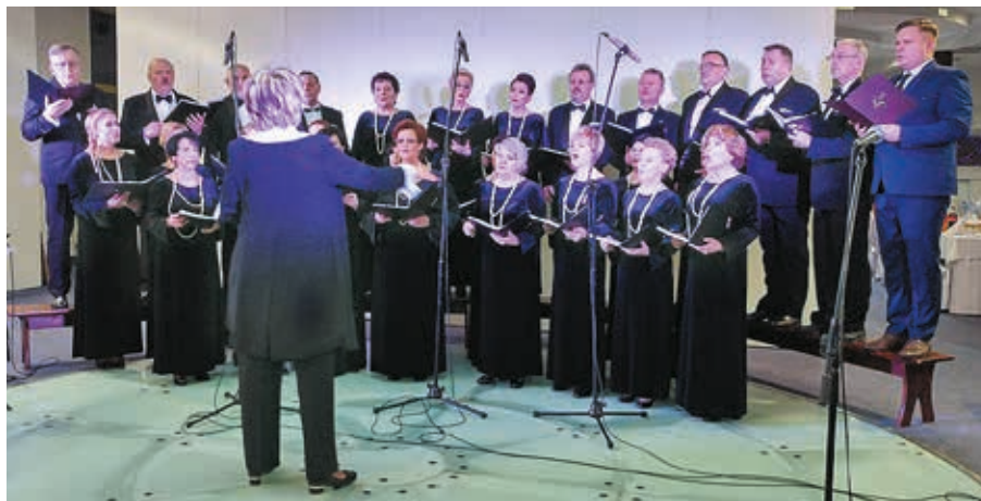
Chór Polskiej Pieśni Narodowej podczas galowego koncertu

Chór Polskiej Pieśni Narodowej w sobotę 19 stycznia br. świętował jubileusz XXV-lecia swojej działalności. W sali konferencyjnej Hotelu Unibus w Bielsku Podlaskim odbył się z tej okazji uroczysty koncert galowy. Na widowni znalazło się wielu znamienitych gości, a wśród nich także przedstawiciele powiatu bielskiego: starosta Sła-