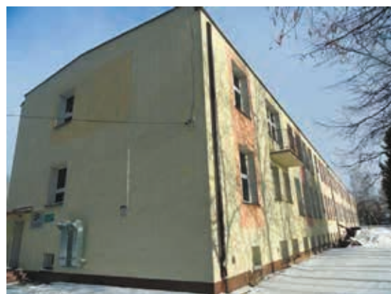
Nowa siedziba Poradni Psychologiczno - Pedagogicznej przy ulicy Widowskiej 1 w Bielsku Podlaskim

Rozporządzeniem MEN z dnia 11 czerwca 1993 r. roku w sprawie organizacji i zasad działania