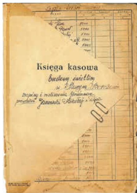
Stron tytułowa księgi kasowej dokumentującej budowę świetlicy

Autor: Mikołaj Janowski Redakcja: Marek Bagrowski