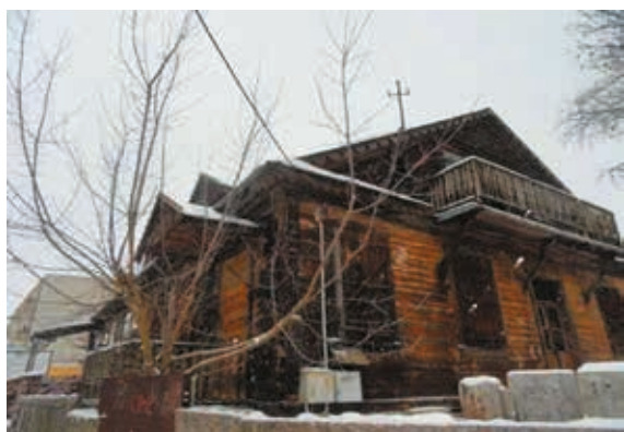
Siedziba Powiatowej Poradni - Wychowawczo - Zawodowej róg ulicy Kościuszki i ulicy 3-go Maja 6 w Bielsku Podlaskim

Kiedy rozpoczynamy pierwszą pracę, myślimy tylko o tym ile będziemy zarabiać, czy to właśnie ta praca, czy odnajdziemy się w nowym środowisku. Z każdym rokiem praca pochłania nas coraz bardziej. Nasza uwaga ukierunkowana jest na ciągłe samokształcenie, zdobywanie nowych doświadczeń,