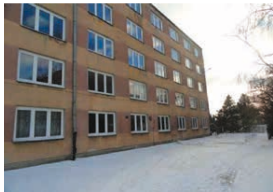
Siedziba Poradni Wychowawczo - Zawodowej przy ulicy Mickiewicza 122 (Bursa Szkolna) w Bielsku Podlaskim

osiąganie coraz to nowych celów. W mniejszym stopniu interesujemy się dziejami naszego miejsca pracy. Bowiernie nie każda placówka świętuje swoje rocznice. Lata 2018 - 2019 to lata ważnych rocznic z punktu