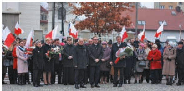
Składanie wiązank pod pomnikiem Św. Jana Pawła II

Tu poczty sztandarowe oddały hołd świątyni, a liczne delegacje złożyły wiązanki pod pomnikiem św. Jana Pawła II.