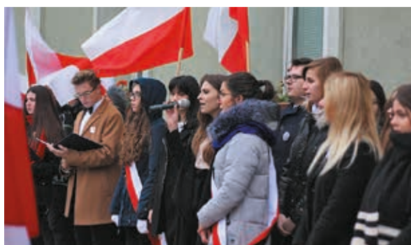
Występ uczniów I Liceum Ogólnokształcącego im. Tadeusza Kościuszki

Kolejnym przystankiem było I Liceum Ogólnokształcące im. Tadeusza Kościuszki, razem z Niepodległą obchodzącą jubileusz swego powołania. Jego uczniowie zaprezentowali krótki program artystyczny o tematyce historycznej. Stąd wyruszone w ostatni etap przemarszu, zatrzymując się przy cerkwi Św. Archanioła Michała i oddając hołd świątyni. Bielski Marsz Niepodległości zakończył się przy pomniku Niepodległości Polski, gdzie kontynuowano uroczystości.