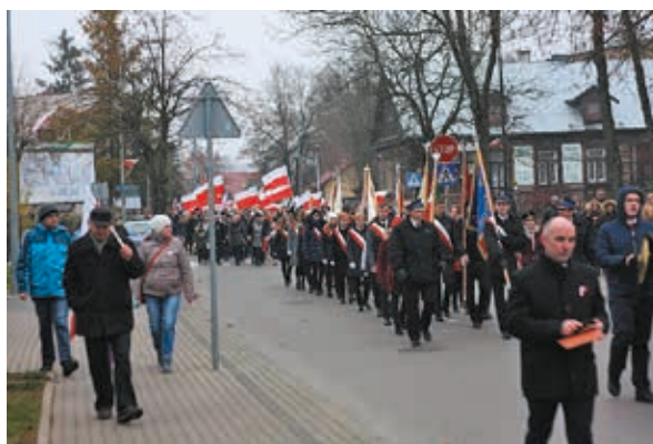
Bielski Marsz Niepodległości

W marszu wzięły udział setki mieszkańców miasta i powiatu. Biało-czerwony pochód poprowadził młodzieżową orkiestrę dętą i poczty sztandarowe, pod niesionymi flagami narodowymi przeszedł ulicami miasta, zatrzymując się przed Bazyliką Narodzenia NMP i Św. Mikołaja.