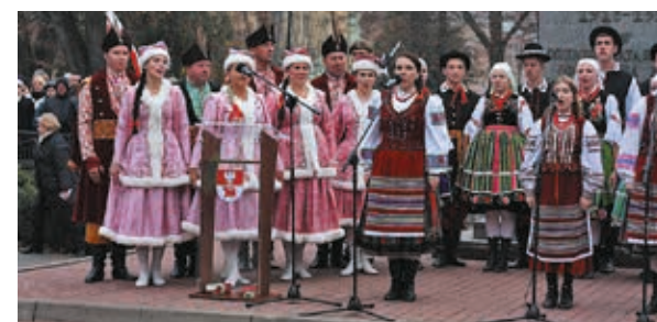
„Niepodległa do hymnu” – śpiewają Podlaskie Kukułki

skiego. My Podlasianie, zbudziliśmy się do czynów niepodległościowych wraz z całą Polską w czasie, gdy wybuchła Wielka Wojna, tak przez Polaków wyczekiwana – mówił starosta.