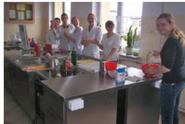
Pracownia w Zespole Szkół Nr 4 im. Ziemi Podlaskiej w Bielsku Podlaskim

Władze powiatu także w przypadku Zespołu Nr 4 im. Ziemi Podlaskiej realizowały politykę rozwijania i wspierania szkolnictwa zawodowego. Już w roku 2011 przeprowadzono modernizację boiska szkolnego. W roku następnym szkoła przystąpiła do projektu „Atrakcyjne kształcenie zawodowe w Bielsku Podlaskim”, dzięki któremu adaptowano pomieszczenia na pracownię informatyki i logistyki i zakupiono do nich wyposażenie. W roku 2015 we współpracy z przedsiębiorcami zrealizowano projekt pn. „Współpraca szkoły z otoczeniem w zakresie kształcenia zawodowego”. W roku bieżącym prowadzony jest remont i wyposażenie warsztatów szkolnych, którego wartość wynosi 1,1 mln zł.