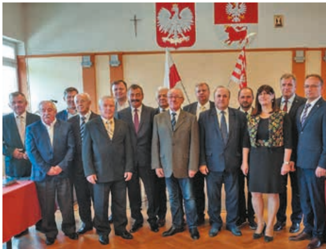
Rada Powiatu V kadencji