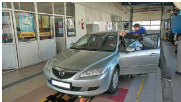
Stacja diagnostyczna przy Zespole Szkół Nr 1 im. Marszałka J.K. Piłsudskiego w Bielsku Podlaskim

Proces zmian w szkolnictwie zawodowym trwa od lat i jest przedmiotem stałego zainteresowania władz powiatu. Pierwsze i najdalej idące decyzje z tym związane zapadały w roku 2007 i dotyczyły przekazania Ministrowi Rolnictwa i Rozwoju Wsi szkół wchodzących w skład Zespołu Szkół Rolniczych im. Krzysztofa Kluka w Rudce oraz połączenia Zespołu Szkół Nr 2 i Zespołu Szkół Nr 1 im. Marszałka Józefa Klemensa Piłsudskiego w Bielsku Podlaskim. Ta druga decyzja wzbudziła duże emocje i kontrowersje w społeczeństwie, jednak z perspektywy czasu okazała się być nadzwyczaj trafna i przewidująca. Zainteresowania młodzieży wówczas były bowiem dalekie od kształcenia budowlanego, powoli odwracały się także od kierunków mechanicznych. W efekcie obie szkoły – budowlana (Zespołu Szkół Nr 2) i mechaniczna (Zespołu Szkół Nr 1), gdyby funkcjonowały do dziś, borykałyby się z ogromnymi problemami z naborem uczniów, co przy narastającym niżu demograficznym doprowadziłoby do ich upadku i konieczności dokonywania zwolnień nauczycieli. Włączenie szkół budowlanych do Zespołu Szkół Nr 1 zapewniło jej możliwość rozkwitu i stały nabór uczniów, a obecne zainteresowanie władz oświatowych wszystkich szczebli rozwojem szkolnictwa zawodowego rokuje jak najlepsze perspektywy dla działalności tejże szkoły.