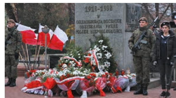
pd, fot. S. Bendella

Tego samego dnia przy amfiteatrze miejskim w bielskim Parku Królowej Heleny odbył się „Piknik dla Niepodległej”. Jego uczestników częstowano grochówką, można też było zapoznać się z pokazami tresury psów policyjnych czy też wyszkoleniem żołnierzy Wojsk Obrony Terytorialnej. Następnie mieszkańcy miasta wzięli udział w koncercie Wielkiego Patriotycznego Chóru Bielska Podlaskiego, śpiewając pieśni patriotyczne i wojskowe.