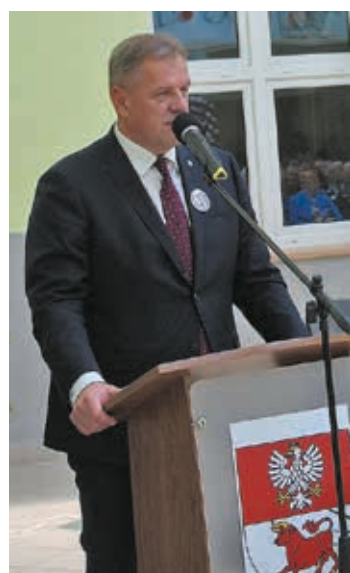
Wystąpienie Starosty S. Snarskiego

okazywanej przez Eksceleńcję przy różnych okazjach, przekazała bukiet kwiatów. Zaprosiła na drugą część uroczystości w szkole.