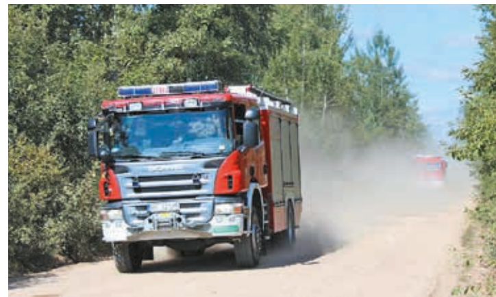
Fot. Straż pożarna w akcji

szczeblu powiatowym. Ponosi on odpowiedzialność za skutki działań własnych, a także powiatowych służb (inspekcji, straży), nad którymi sprawuje zwierzchnictwo. Warto wspomnieć również o fakcie, że starosta jako zwierzchnik administracji zespolonej w powiecie ma wpływ na obsadę stanowisk powiatowych komendantów (Policji i Państwowej Straży Pożarnej) oraz inspektora nadzoru budowlanego.