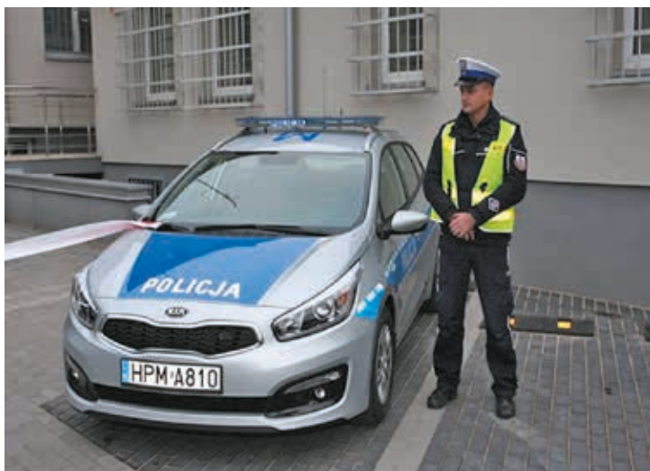
Fot. Radiowóz zakupiony ze środków budżetowych powiatu bielskiego

pieczeństwa i porządku. Ich działalność umożliwia tworzenie systemu bezpieczeństwa na poziomie lokalnym oraz ułatwia współpracę podmiotów w tym zakresie.