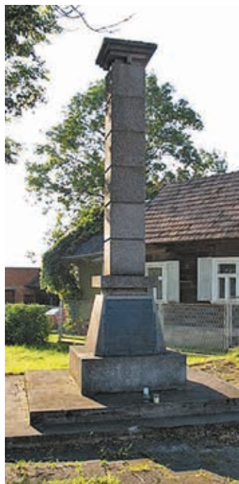
To na tym pomniku znajdowała się zdekomunizowana tablica

Proponowany napis ogranicza się tylko do tej pierwszej grupy pomordowanych. Ta druga grupa wg. poprawiaczy historii rozplynęła się w absurdach twórców kraju bez historii. Każdy rozsądny człowiek wie, że w historii każdego państwa są różne, czarne i białe, a najczęściej szare karty, każde rozsądne władze szanują wszystkie te oblicza historii. Nie tworzą siłą nowych podwalin historii, wiedząc, że jest ona nietrwała. Bolesnie przekonali się o tym twórcy PRL, ich pomniki - wielokrotnie wbrew woli społeczeństwa - znikają z przestrzeni publicznej a na ich miejsce pojawiają się inne, także kontrowersyjne. Tak też dzieje się w Narewce, gdzie historia skomplikowanego pogranicza sku-