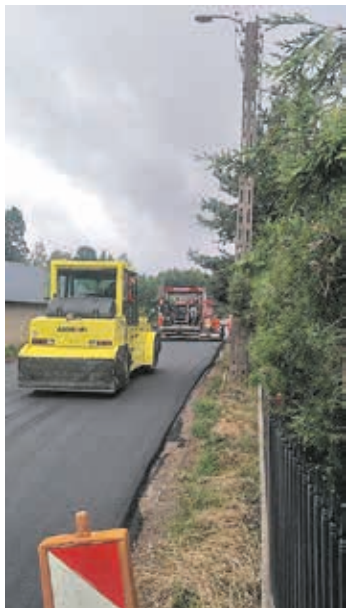
Fot. Przebudowana droga w miejscowości Popławy

Cd. ze str. 2 14.08.2018 r., zaś obecny stopień zaawansowania robót wynosi 80%. Zadanie jest realizowane w ramach „Narodowego Programu Przebudowy Dróg Lokalnych” przy wsparciu finansowym Gminy Brańsk.