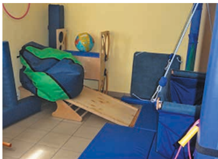
Fot. Gabinet do terapii integracji sensorycznej

Do tej pory z Ośrodka skorzystało ponad 50 rodziców i 44 dzieci. Systematycznie na zajęcia z integracji sensorycznej uczęszcza 19 dzieci. Terapią rehabilitacyjną