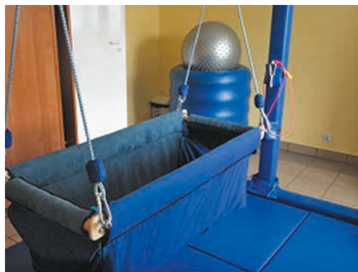
Fot. Gabinet do terapii integracji sensorycznej

Już w pierwszych dniach działalności Ośrodka został opracowany plakat informacyjny, rozpropago-