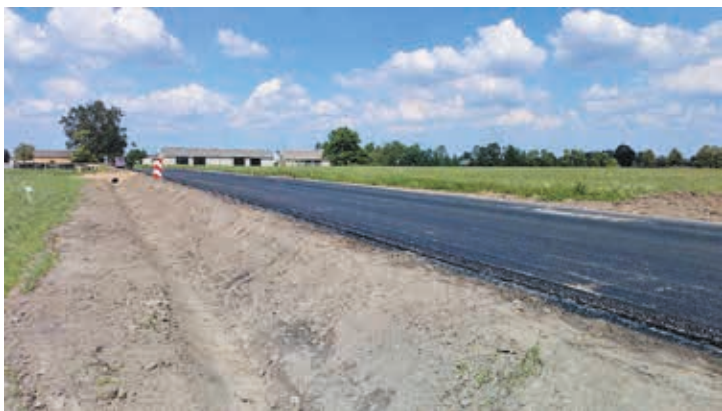
Fot. Prace budowlane w miejscowości Krywiatycze

w miejscowości Krywiatycze. Odcinek o długości 0,98 km, wartość robót to 1 570 246 zł. Wykonawcą robót jest Przedsiębiorstwo Drogowo – Mostowe MAKSBUD Sp. z o.o. Zadanie zrealizowano przy wsparciu finansowym samorządu Gminy Orla.