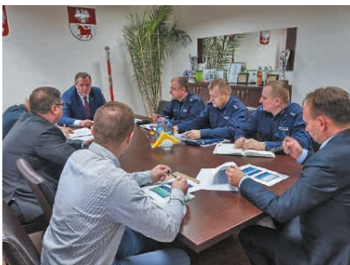
Fot. Posiedzenie Komisji Bezpieczeństwa i Porządku Publicznego, grudzień 2017

przecenienia. Mają one za zadanie organizować działania w zakresie bezpieczeństwa i porządku publicznego na administrowanym terenie, a także koordynować współdziałanie podległych im gmin. Do zadań wykonywanych przez powiat należą również zadania powiatowych służb, inspekcji i straży, które mimo że znajdują się w zakresie administracji rządowej, są realizowane pod zwierzchnictwem starosty. W związku z tym tworzone są komisje bez-