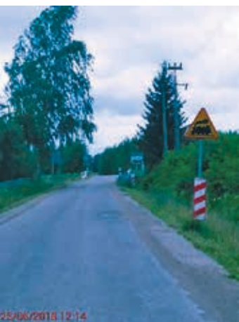
drogi do Skryplewa,