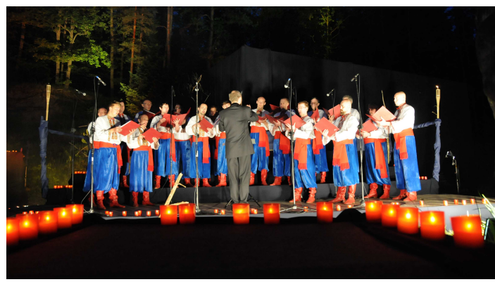
Koncert plenerowy przy OEL „Jagiellońskie”: z lewej „Ukraiński Chór Męski „Żurawi” z Warszawy, z prawej Chór „Rodolubets” Liceum im. Ch. Boteva z Wala Porzeż (Mołdawia).