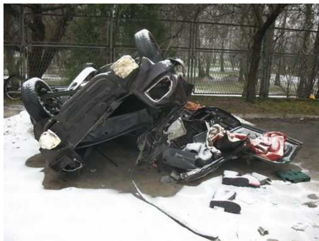
Wrak Forda na placu Komendy Policji