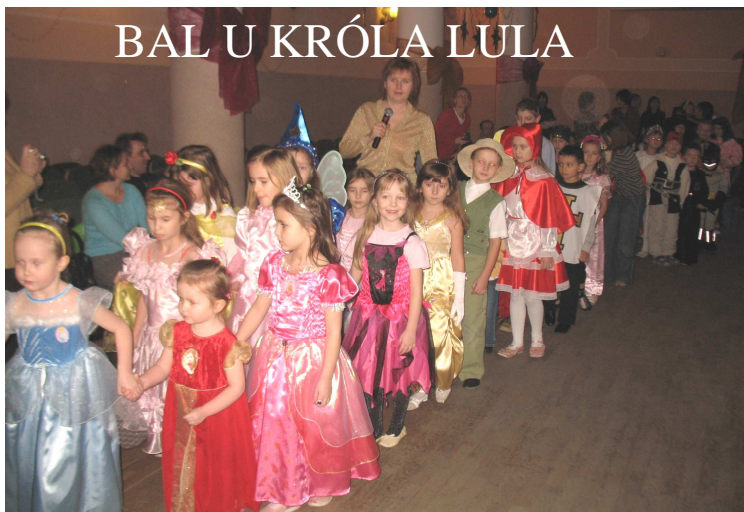
28 stycznia przed Hajnowskim Domem Kultury zaparkowały zaczarowane karety, a z nich wysiadły prawdziwe królewny... Wszystkie dzieci przybyły, by bawić się na prawdziwym balu u króla LULA.